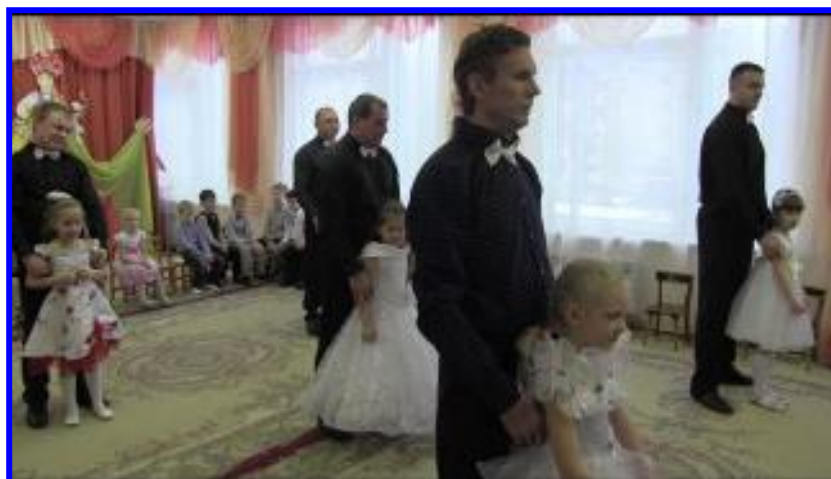
Сольный танец пап и дочек