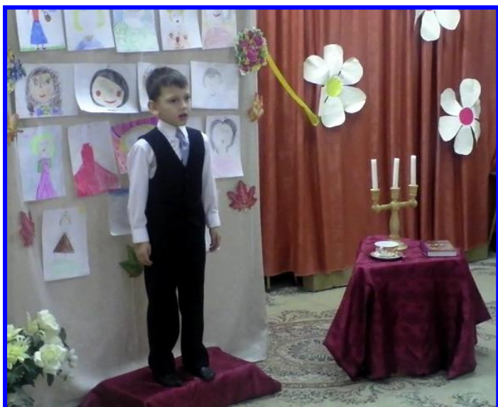
Литературный вечер посвящённый «Дню Матери»