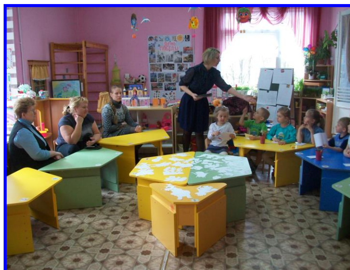
Литературная викторина с родителями «Путешествие по сказкам»