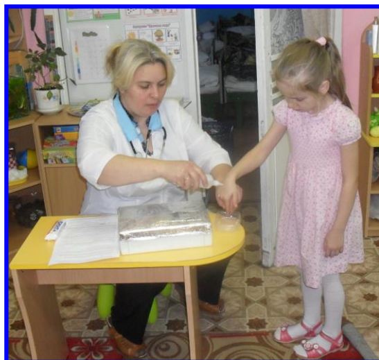
А у меня мама - фельдшер