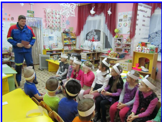
Мой папа – электрик

Родители, члены семьи могут значительно разнообразить жизнь детей в детском образовательном учреждении, внести свой вклад в образовательную работу. Детский сад – это открытая система, предполагающая «открытость внутрь» и «открытость наружу». При этом «открытость детского сада внутрь» предполагает вовлечение родителей в образовательный процесс детского сада. Поэтому и необходима такая форма работы как «Гость группы». Такая форма работы способствует сближению детей, родителей и воспитателей. Родители беседовали с детьми о профессиях, проводили игры и др. такое взаимодействие понравилось и детям и взрослым.