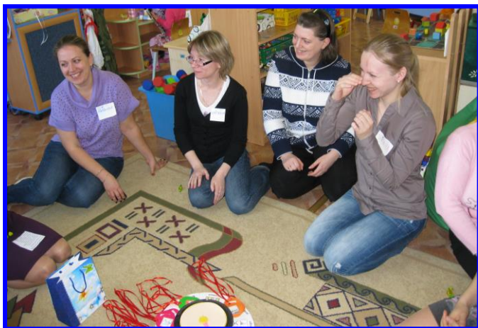
Родительское собрание «Игра как средство воспитания»