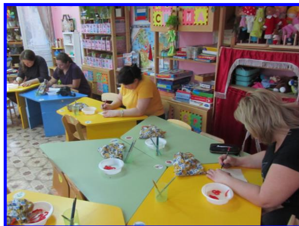
Родительское собрание «Готовность ребёнка к школе»